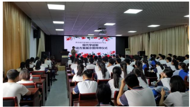
室内设计专业学徒方案介绍

通过现代学徒制的人才培养，初步构建了适合学生个性成长的课程体系。课程体系从人才培养目标、课程、管理、考核等方面细化了人才培养的过程，提高了人才培养质量。在双导师的培养下，学生的技能水平更加贴近了社会岗位需求，学生的幸福感也得到了大大的提升。参加现代学徒制人才培养的学生在各级技能大赛中取得了优异成绩，进一步表明了，人才培养