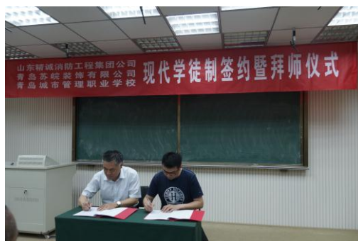
校企签订现代学徒合作协议