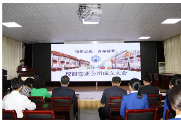
校园物业公司成立

青岛城市管理职业学校物业管理专业是多学科、多技能相互交融的专业。非单一化技能学习，再次把技能学习成效转化的重要性凸现出来。为更好提升学