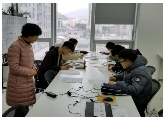
销售课程搬进企业

在学徒培养过程中，采用“三计划（学校教学方案+行业培养方案+企业培养方案）、三带头人（学校+行业+企业）、三导师（学校教师+行业专家+企业师傅）、三身份（学生+协会成员+准员工）、三评价（学校考试+企业考核+行业考核）的“三主体”人才共育模式。