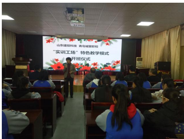
客户信息服务专业创新教学模式

在高一年级，根据专业特色和合作企业用人需求，主要进行文化课程、专业课程及企业文化课程；高二年级，根据企业业务需求，两个班级轮流到实训室进行岗位实战。在整个过程中，企业负责业务收集、业务培训、维护管理、学生业务统计、学生待遇发放等工作；