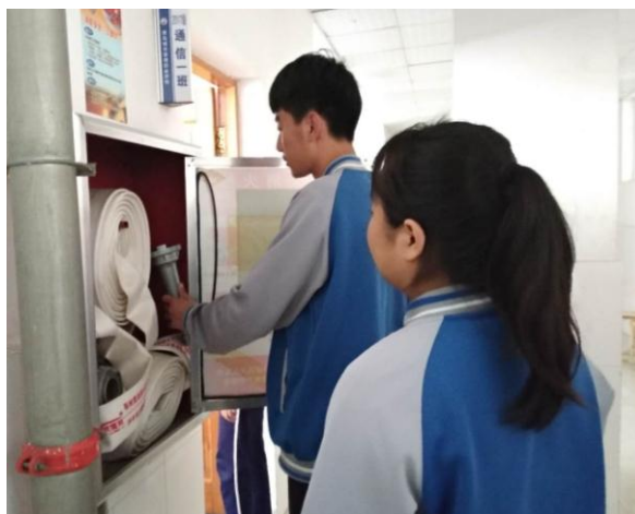
巡检校园消防设备